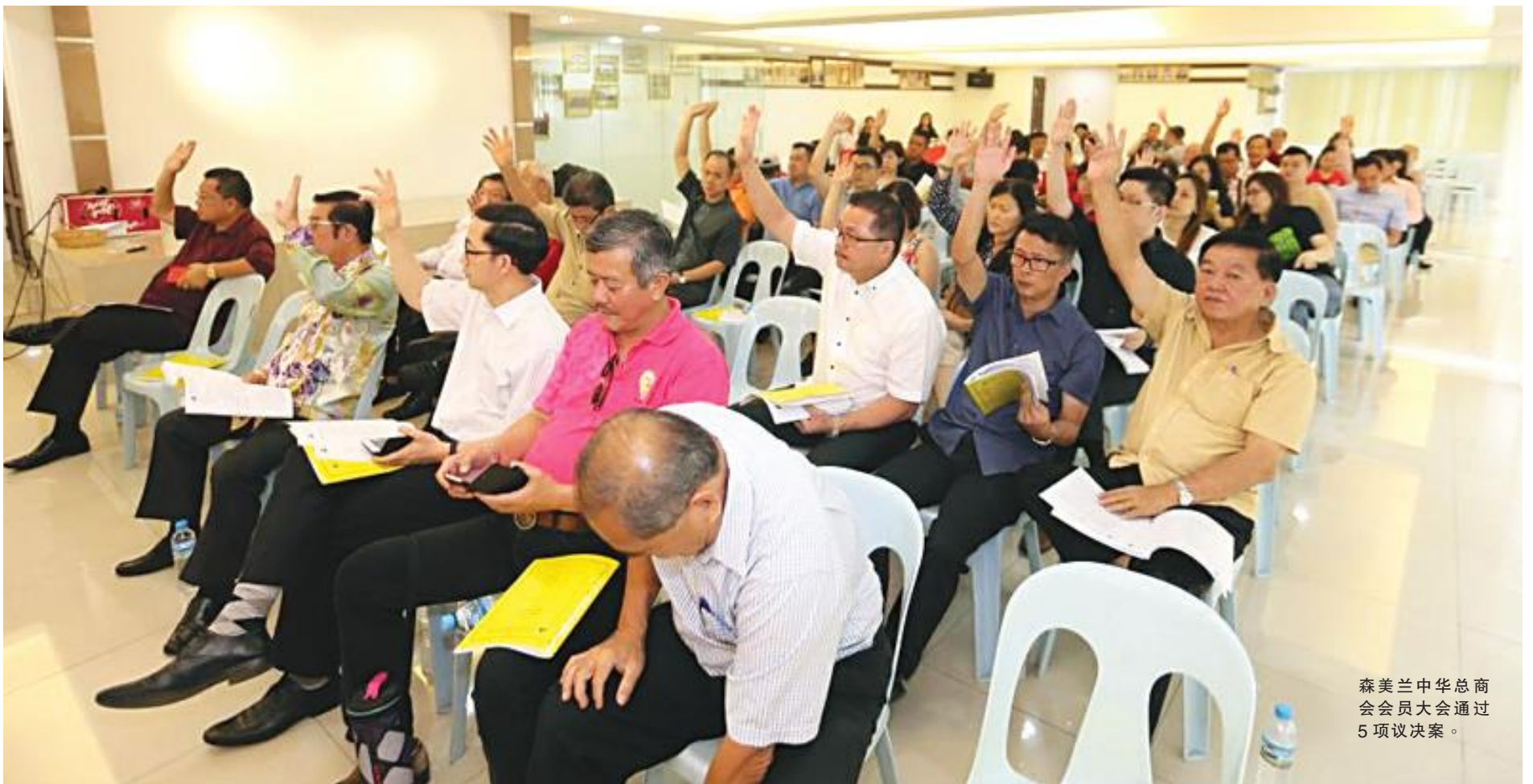
森美兰中华总商会会员大会通过 5 项议决案。