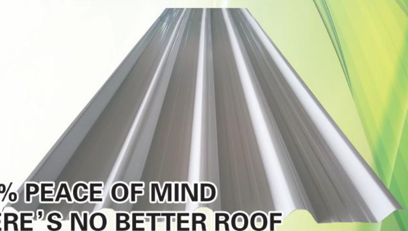
PROFILE ECL 48 SUPER WIDE

100% PEACE OF MIND THERE'S NO BETTER ROOF