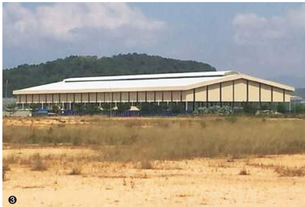
1.坐落在芙蓉奥克兰工业园的东洋机械工程有限公司。2.东洋商机械工程提供机械工程建设及管理一揽子服务。3.东洋机械工程有限公司斥资 2500 万令吉，在芙蓉达城增建新厂，以拓展业务。