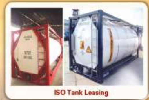
ISO Tank Leasing