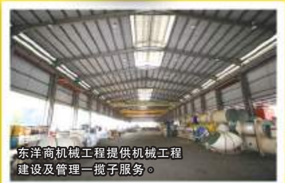
东洋商机械工程提供机械工程建设及管理一揽子服务。