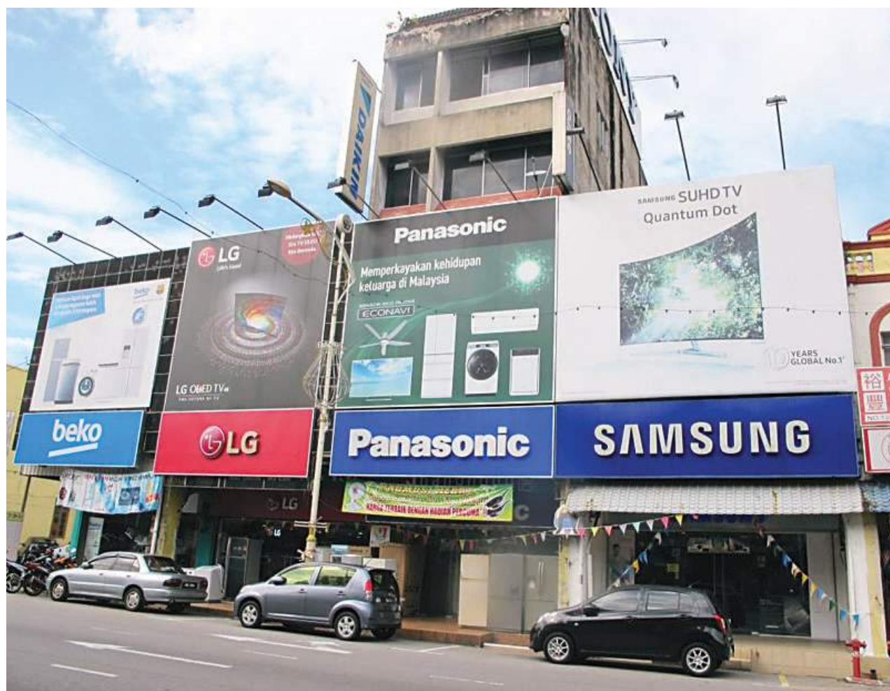
坐落在芙蓉拿督邦达东嘉路的“南方电器销售服务”有限公司店址。

科技愈趋尖端化发展，家庭电器也愈趋智能化，更多创新型的电器产品涌现市场，给精明消费者更多、更美好的生活体验。