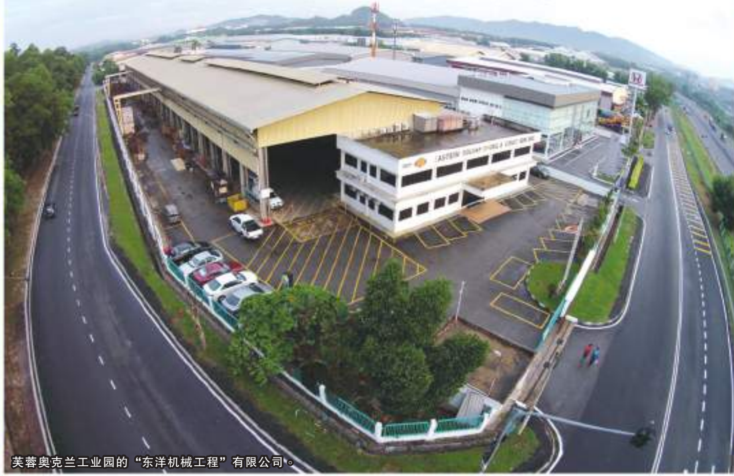
芙蓉奥克兰工业园的“东洋机械工程”有限公司。