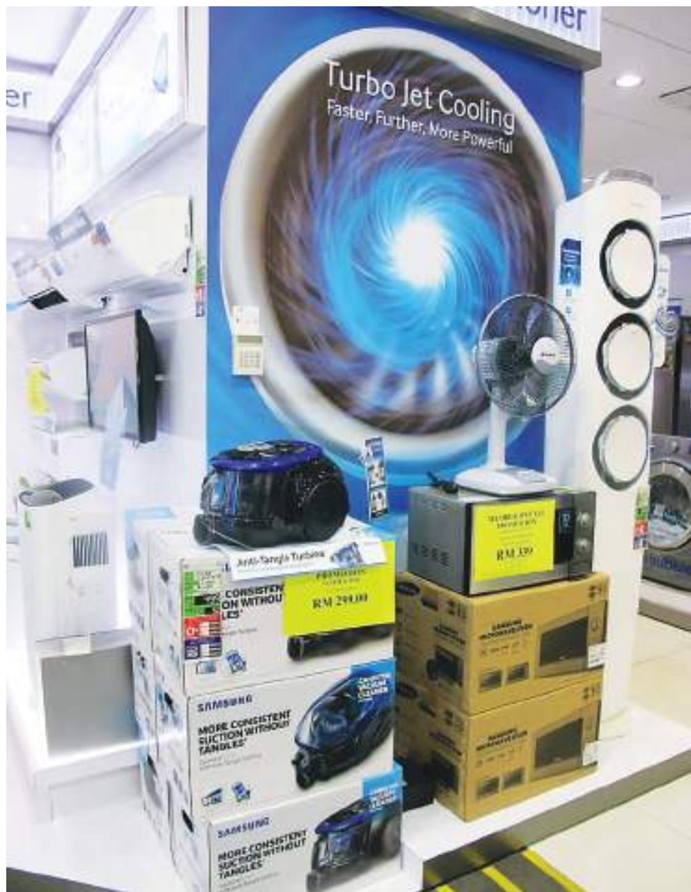
生活品质的提升，电器商有更多智能化及高端化产品行销。