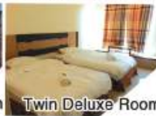
Twin Deluxe Room