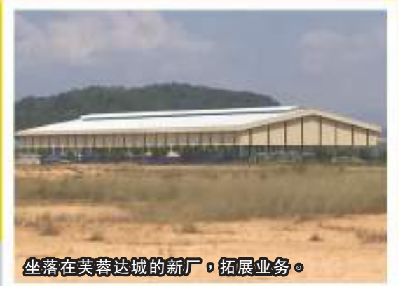
坐落在芙蓉达城的新厂，拓展业务。