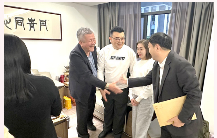
到访广东丹青印刷有限公司。