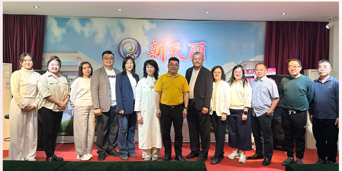
拜访新天丽控股有限公司。

By visiting the printing corporations, the delegation was tasked to enhance ties with the relevant industries between NSCCCI and Chaozhou for collaboration.