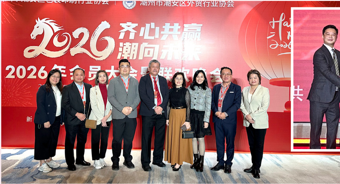
森中总代表们出席潮州市潮安区包装印刷行业协会暨潮安区外贸行业协会的联欢晚会。