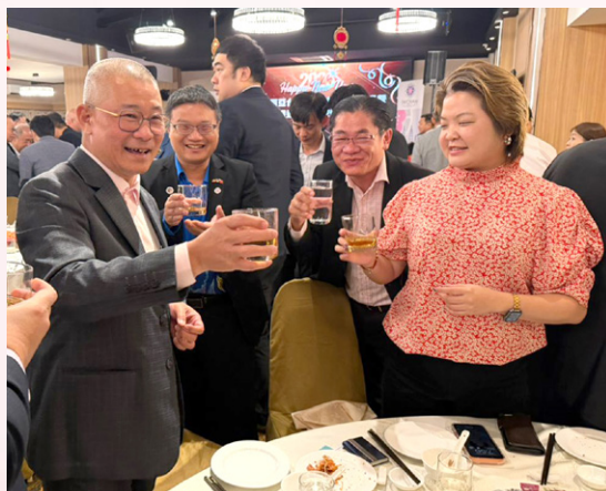
黄伟哲赠送纪念品予拿督吕海庭。

The welcome dinner on Jan 24 was significant in fostering good relations between Malaysia and Taiwan.